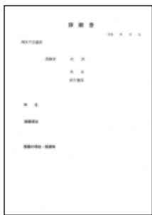
*なるべくA4判にしてください。 (なお、市会ホームページから書式をダウンロードすることができます。)

※陳情の内容によっては、委員会での審査や市長等からの回答を求めない取扱いとすることがありますので、ご注意ください。